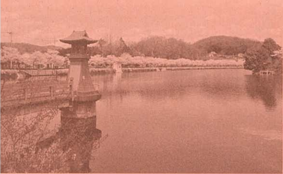
上野公園の桜(庄原市)