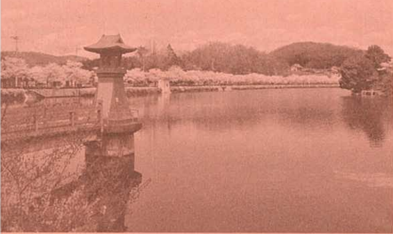
上野公園の桜(庄原市)