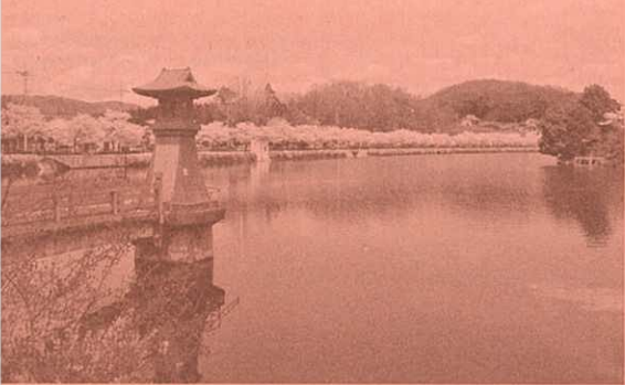
上野公園の桜(庄原市)