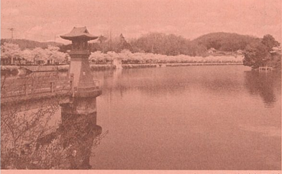
上野公園の桜(庄原市)